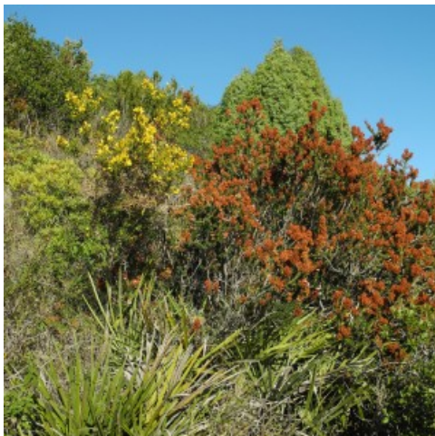
Margalló, gatosa, bruc, ginebrera... Cap desert, tot jardí de reravera!