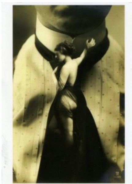
«Krawattennymphe», carta postal de Peter Weiss de l'any 1910

No saps amb quina mà el meu nu et despulla. No saps per quin coll