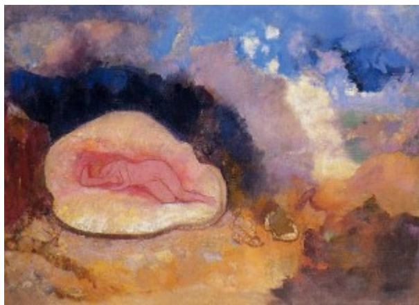
[«El naixement de Venus», d'Odilon Redon, 1912]