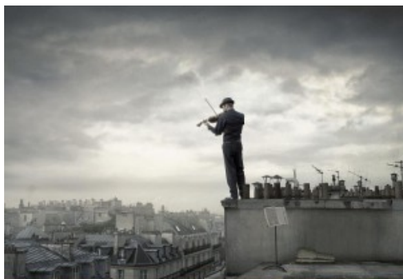
Vi i violí

Música alè color de vi. L'absent que no presenta al·legacions rима grinyols de violí.