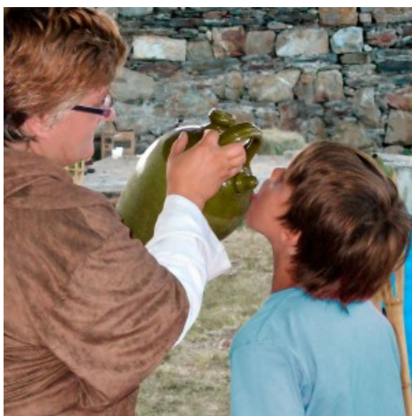
El càntir verd

I encara diran que l'aigua és vida. Però la vida és set.