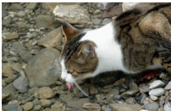
Gat amb set i sis vides

A set de gat t'acompararé. Buit a la vuit, aquesta emplenes.