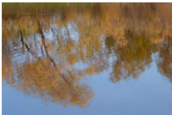
La llum riu

comissures del cel als solcs de la set, la llum riu