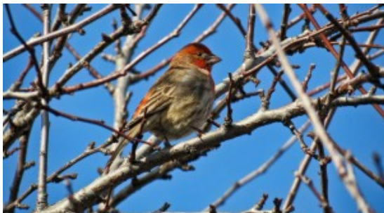
Ocell amb branca