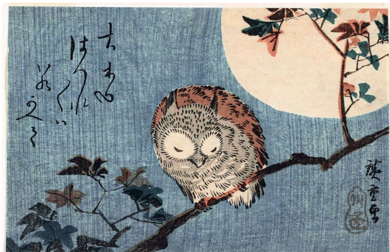
«Owl on a maple branch in the full moon». Hiroshige , 1832-33.