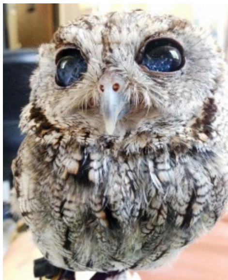
Mussol amb univers interior