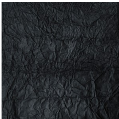
Nit de paper negra