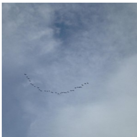
Somriure al vol

En formació i cap al nord, en l'aire es dibuixa un somriure d'oques.